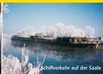
Schiffverkehr auf der Saale