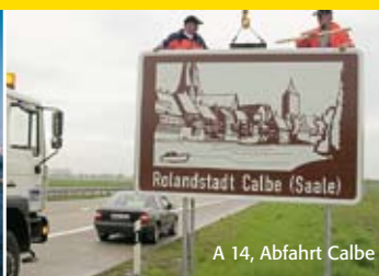
A 14, Abfahrt Calbe