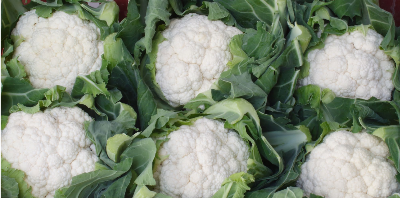
In einer 6er-Kiste Blumenkohl müssen alle Köpfe gleich groß sein.