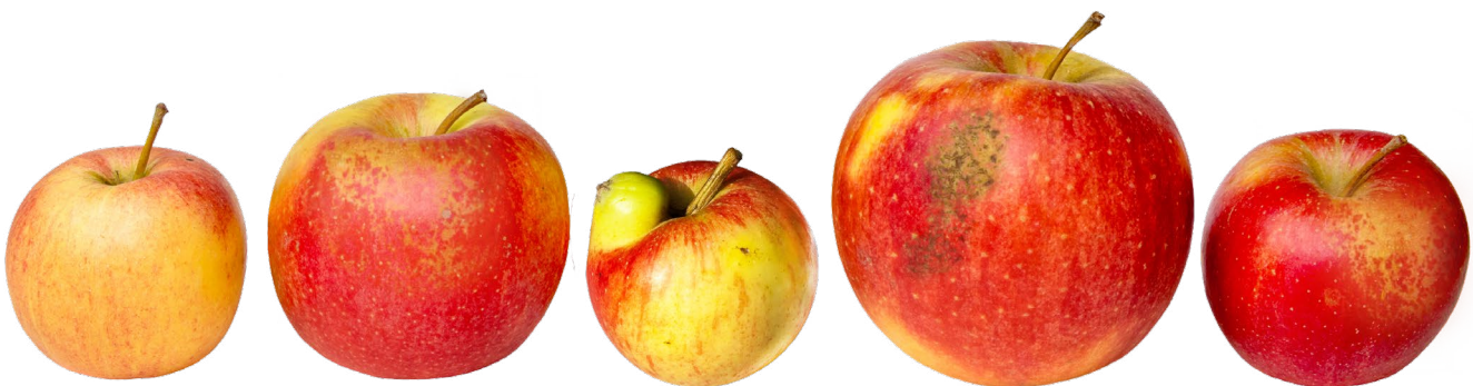
Kleine Makel und unterschiedliche Größen – so könnten Äpfel vom Handel verkauft werden.

Für Äpfel gelten die Speziellen Vermarktungsnormen der EU 7 , die eine Klasseneinteilung in Extra, I und II vorsehen. Im Handel werden aber überwiegend Äpfel der Klasse I angeboten. 8 Das bedeutet für die Erzeugerbetriebe, dass diese Früchte nur geringe Schalenfehler aufweisen dürfen, also zum Beispiel nur eine leichte Berostung 9 der Schale 10 , keine oder sehr minimale Schorfflecken 11 sowie kaum Witterungsschäden.