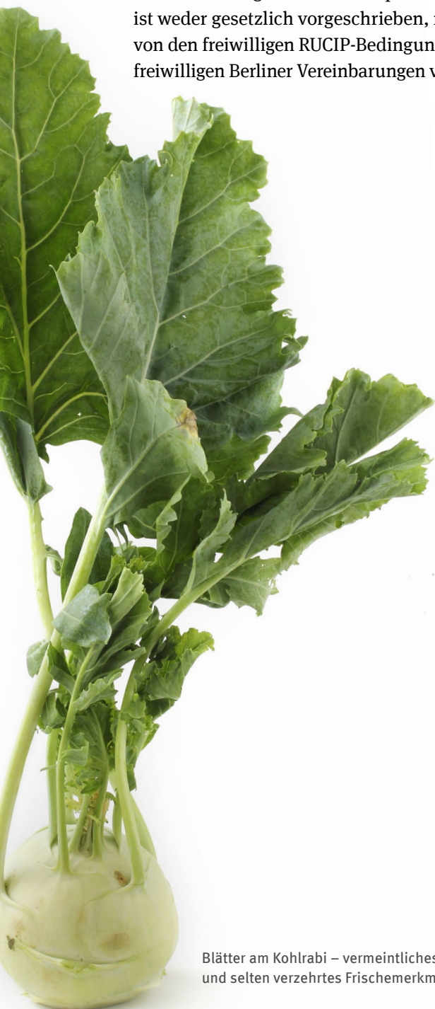
Blätter am Kohlrabi – vermeintliches und selten verzehrtes Frischemerkmal.

Der Handel verlangt in den meisten Fällen, dass Kartoffeln sauber und frei von Erde sind. Kartoffeln müssen daher gewaschen und poliert werden. Dies ist weder gesetzlich vorgeschrieben, noch wird es von den freiwilligen RUCIP-Bedingungen oder den freiwilligen Berliner Vereinbarungen verlangt.