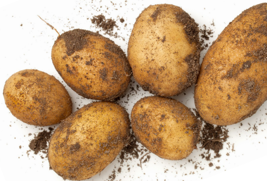
Erdreste an Kartoffeln können durch Waschen oder Schälen zuhause leicht entfernt werden.

Kartoffeln sollten ungewaschen und unpoliert verkauft werden.