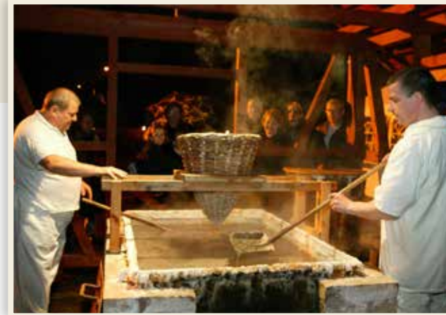
Halloren beim Salzsieden

Nach einer frühen Nutzung der Salzquellen in der Bronzezeit sind vier mittelalterliche Solebrunnen in der Nähe der Marktplatzverwerfung historisch bezeugt. Als letztes Zeugnis des halleschen Salzwerks im „Thale zu Halle“ kündigt der Gutjahrbrunnen in der Oleariusstraße von dieser salzigen Historie. Hallesches Salz wird auch heute noch nach altem Vorbild von den Halloren, den halleschen Salzsiedern, auf der 1721 vor der Stadt gegründeten ehemaligen Königlich Preußischen Saline hergestellt.