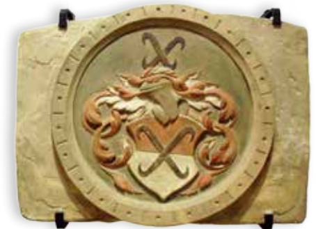
Wappen des Salzgrafen

Die 1491 gegründete Bruderschaft der Halloren überdauerte die Zeiten und pflegt noch heute die reiche Tradition der Halleschen Salinearbeiter.