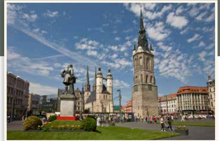
Der Marktplatz in Halle (Saale) mit den fünf Türmen

An die 100 Siedekothlen gab es auf der mittelalterlichen Thalsaline, die sich im Bereich des heutigen Hallmarktes befand. Die dortige Produktion lag in den Händen der Salzwirker, die ab dem 18. Jahrhundert in Halle als Halloren bezeichnet wurden. Dem Salz verdanken die Pfänner Wohlstand und Macht. 1276 schlossen sich diese zur Halleschen Pfännerschaft zusammen und bildeten eine machtvolle städtische Oberschicht.