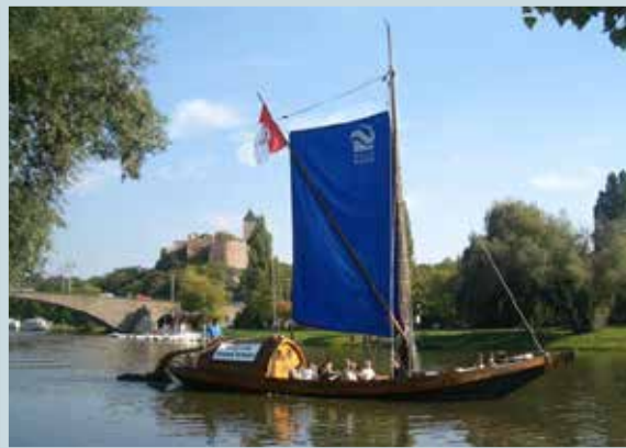
Der historische Kaffenkahn „Askania“ auf der Saale vor der Burg Giebichenstein

So schwärmte Anfang des 19. Jahrhunderts der junge Joseph von Eichendorff über Kröllwitz bei Halle, und Franz Kugler schrieb 1826 mit dem Gedicht „An der Saale hellem Strande“ seinerseits eine Hymne auf das romantische Saaletal.