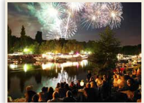
Das Laternenfest – ein Volksfest für die ganze Familie