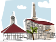
Optional: Besichtigung des Technischen Halloren- und Salinemuseums