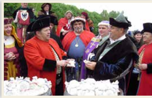
Hanseschar beim Salzhandel mit Halloren

Halle (Saale) ist wahrhaftig ein Ort kultureller Höhepunkte. Gesäumt von einer über 1.200-jährigen städtischen Historie, bietet die Stadt vielfältigste kulturelle und wissenschaftliche Angebote für jeden Geschmack. Kulturelle Leuchttürme sind die Franckeschen Stiftungen, das Landeskunstmuseum in der Moritzburg, das Landesmuseum für Vorgeschichte mit der Himmelsscheibe von Nebra sowie das Händel-Haus, die zu den bedeutendsten Museen und Einrichtungen des nationalen Kulturerbes der Bundesrepublik Deutschland zählen.