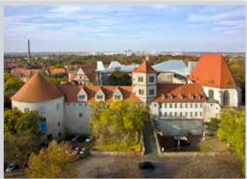
Moritzburg, die jüngste Burg an der Saale (erbaut 1503)

Die Palette reicht vom Mysterium der mehr als 3.600 Jahre alten Himmelsscheibe zu Nebra, ausgestellt im Landesmuseum für Vorgeschichte, über die beachtlichen baulichen Zeugnisse der Früh-Renaissance des Kardinals Albrecht von Brandenburg, die Totenmaske von Martin Luther bis hin zum barocken Musikschaffen des berühmtesten Sohnes der Stadt, Georg Friedrich Händel.