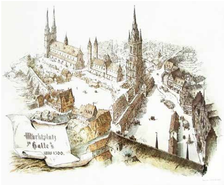
Der Marktplatz zu Halle an der Saale anno 1500; Gestaltung von Gustav Friedrich Hertzberg (1889), Geschichte der Stadt Halle an der Saale, Band I

Halle an der Saale zählt zu den ältesten Salinestädten. Die Salzquellen waren durch Kaiser Otto I. im Jahre 961 dem Moritzkloster zu Magdeburg, dem späteren Erzbistum, verliehen worden. Als Ort der mittelalterlichen Salzproduktion lag damit das „Thal zu Halle“ im Eigentum der Erzbischöfe von Magdeburg. Im Frühmittelalter übergab der Erzbischof Solgut als Lehen an die so genannten Pfänner, die damit das Recht erhielten, die im Thal geförderte Sole in eigens dafür errichteten Hütten, zu Salz zu versieden.