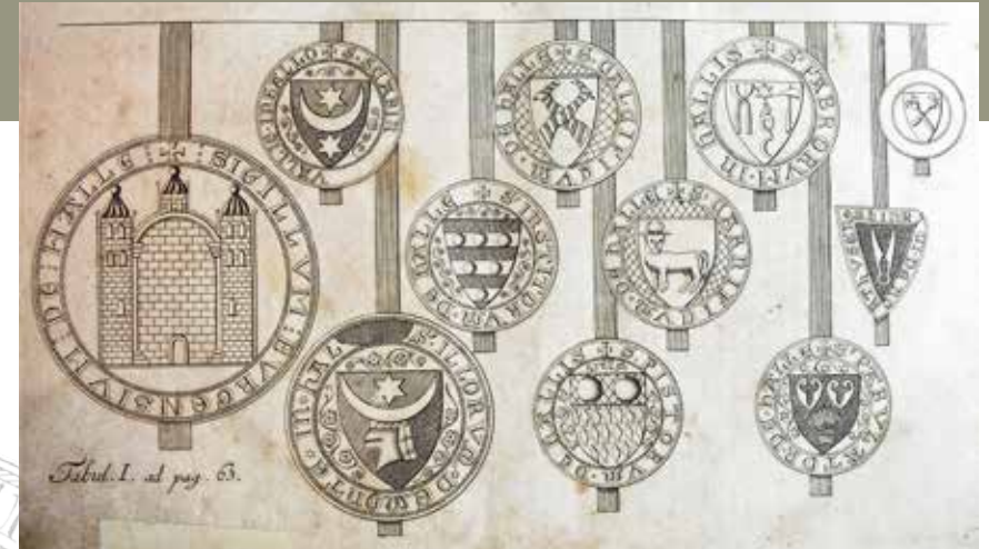
Bürgerschaftssiegel und Wappen der Zünfte, Abbildung: Dreyhauptsche Chronik

Die Unterwerfung der Saalestadt durch den Magdeburger Erzbischof bereitete der autonomen Entwicklung der Stadt Halle ein jähes Ende. Zur Absicherung seiner Macht zerstörte Erzbischof Ernst die wirtschaftliche Grundlage der Pfännerschaft und nahm eine Veränderung der kommunalen Verfassung der Stadt in Angriff. Die pfännerschaftliche Genossenschaft wurde aufgehoben, die Salzgüter vom Erzbischof neu, meist an Vertreter der Innungen und „Gemeinheiten“, vergeben. Führer der unterlegenen Partei mussten die Stadt verlassen.