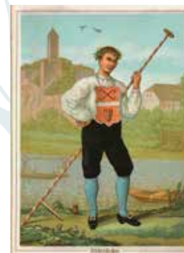
Fischerstecher der Halloren, Abb. von Alfred Kirchoff 1888

Heute stellt die über 25 km durch die Stadt fließende Saale ein beliebtes Erholungsgebiet für die Hallenser sowie die Besucher der Stadt dar. Neben den Angeboten für Wasserwanderer wartet der beliebte Saaleradweg mit vielen unvergesslichen Eindrücken auf. Seit Anfang des vergangenen Jahrhunderts feiern die Hallenser alljährlich ihr Laternenfest auf und an der Saale, bei dem neben einem Bootskorso mit Höhenfeuerwerk auch das traditionelle Fischerstechen der Halloren zu bewundern ist.