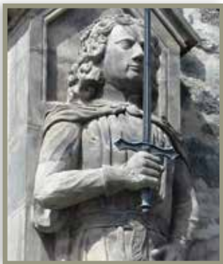
Rolandfigur am Roten Turm (1854)

Wie in zahlreichen Städten war die innere Lage der Stadt Halle im ausgehenden 15. Jahrhundert geprägt vom Gegensatz zwischen einer oligarchischen Oberschicht, die die Zusammensetzung und den Kurs des städtischen Rates dominierte, und einer „demokratisch“ anmutenden Opposition, der Innungen der Handwerker und der „Gemeinheiten“, der Vertreter der einzelnen Stadtviertel. 1478 kam es zwischen ihnen zu erbitterten innerstädtischen Konflikten. Nachdem mit Kanonen bewaffnete Salzwirker und Bornknechte zunächst strategisch wichtige Punkte besetzt hatten, sahen die Führer der Innungen und „Gemeinheiten“ ihr Heil im Anschluss an den erst 14-jährigen Erzbischof Ernst; so wurde am nördlichen Ausgang der Großen Ulrichstraße das Ulrichstor für die von Heinrich von Ammendorf geführten erzbischöflichen Truppen geöffnet, die rasch die Oberhand im Stadtgebiet gewannen.