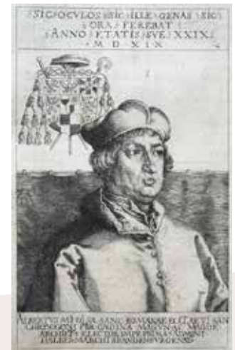
Albrecht von Brandenburg (1490 – 1545), Erzbischof von Magdeburg

Salz, das weiße Gold der Halloren – der ältesten Salzwirkerbrüderschaft der Welt – und verführerisches Süßes aus Deutschlands ältester Schokoladenfabrik „Halloren“ belohnen jene, die sich in Halle Zeit zum Entdecken und Genießen nehmen.