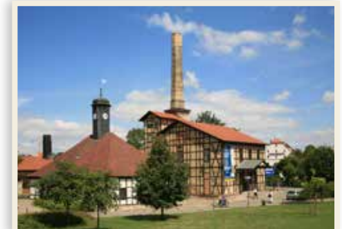
links: Halloren im traditionellen Festkleid rechts: Technisches Halloren- und Salinemuseum Halle (Saale)