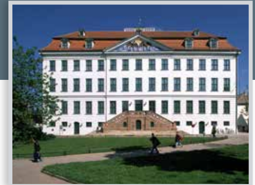
Hauptgebäude der Franckeschen Stiftungen (erbaut 1701)

Modern und zukunftsorientiert präsentiert sich Halle ebenfalls im Bereich der Forschung und Bildung. Ausgehend von universitären Gründungen in Halle (1694) und Wittenberg (1502) gehört die Martin-Luther-Universität Halle-Wittenberg (MLU), die erste reformierte Universität überhaupt, mit ihren 19.000 Studenten heute zum lebendigen Teil der Stadt. Als Volluniversität bietet die MLU breitgefächerte Möglichkeiten zum Studieren. Architektonisch zählt der zentral gelegene Universitätsplatz mit seinem klassizistischen Hauptgebäude zu den schönsten Universitätsplätzen Europas.