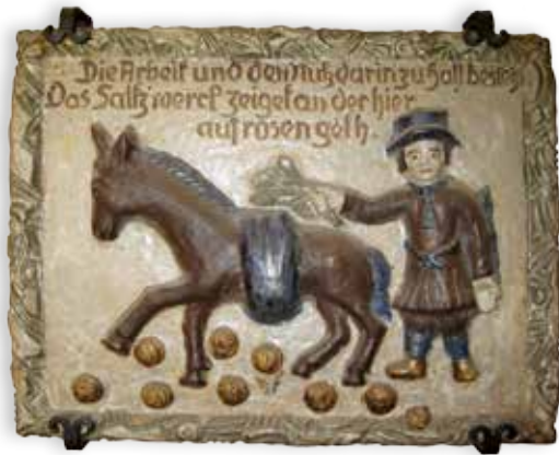
„Der Esel, der auf Rosen geht“, hallesches Symbol

Salz, einst Gabe der Götter, ist bis heute unverzichtbarer Bestandteil des Lebens. Der Organismus benötigt zum Funktionieren täglich ganze sechs Gramm des weißen Goldes. Dabei finden nur fünf Prozent des weltweit geförderten Salzes als Lebensmittel den Weg in unseren Alltag. Die verbleibenden 95 Prozent nutzt die Industrie unter anderem zur Herstellung von Kunststoff. Halle an der Saale hat sein reiches, oberirdisches Salzvorkommen dem