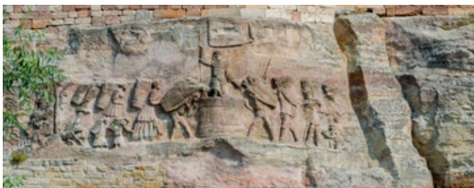
Steinernes Bilderbuch Großjena