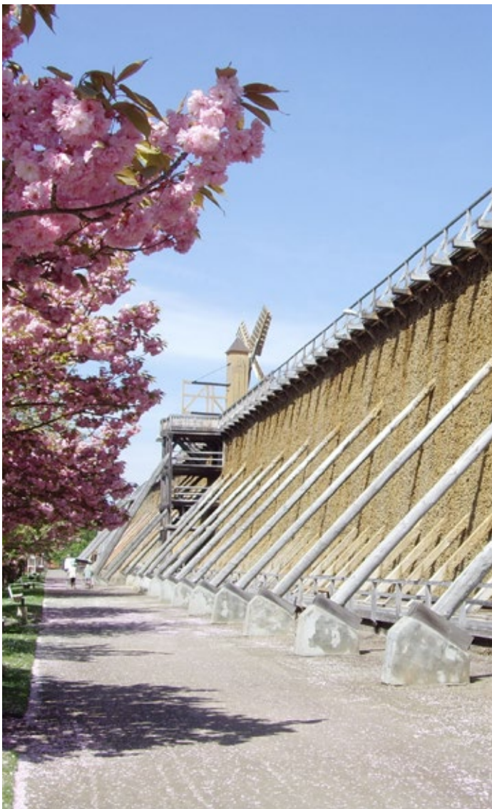
Gradierwerk Bad Dürrenberg

Im Städtedreieck zwisch Halle an der Saale, Leipzig und Naumburg liegt der staatlich anerkannte Erholungsort Bad Dürrenberg – die Stadt mit dem Salz in der Luft. An einer Kombination von etwa 8000-jähriger Siedlungsgeschichte, Sole und Gradierwerk, Kultur sowie Natur erfreuen sich vor allem Tagesausflügler und Radler-Freunde.