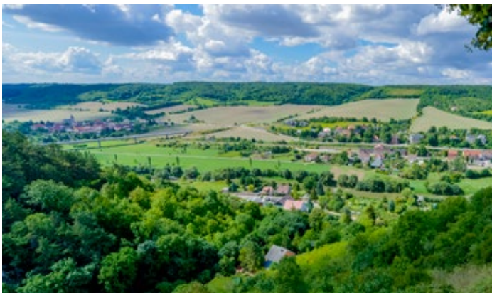
Blick in das Unstruttal