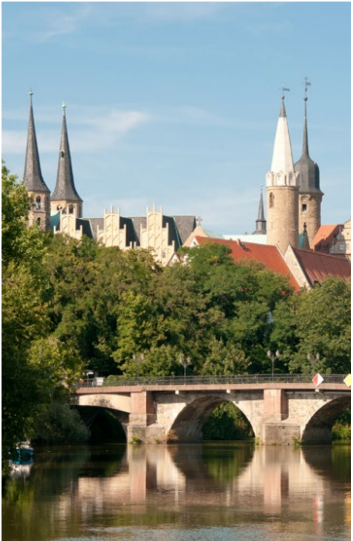
Merseburger Dom- und Schlossensemble

Die imposanten Schlossanlagen beinhalten Ausstellungen, die die Blütezeit dieser Residenzschlösser mit kulturhistorischem Erbe darstellen. Im herrlichen Umland locken weitere sehenswerte Ziele zu Ausflügen an.