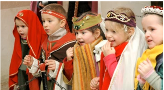
Kinderkemenate im Schloss Neuenburg

Wie könnte ein so erlebnisreicher Tag schöner ausklingen als beim Lagerfeuer mit urigem Stockbrot und lustigen Geschichten, z. B. im Jugend- und Sporthotel Euroville Naumburg oder im Waldhof Görtschen.