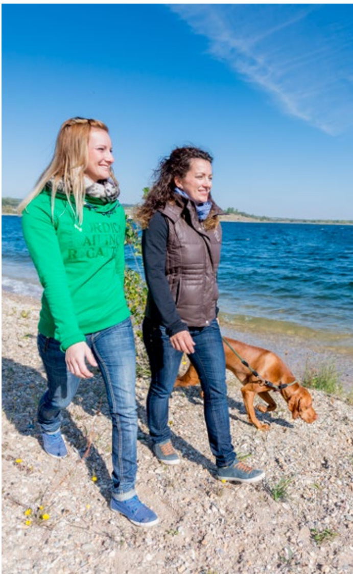
Spazieren am Geiseltalsee

In idealer Landschaft gelegen, befindet sich der größte künstliche See Deutschlands - der Geiseltalsee. Besucher können sich am, im und auf dem See erholen. Das Naherholungs-, Urlaubs- und Wassersportgebiet lädt mit seinem ca. 30 km langen asphaltierten Rad- und Wanderweg, welcher um den See führt, zu Erkundungen ein.