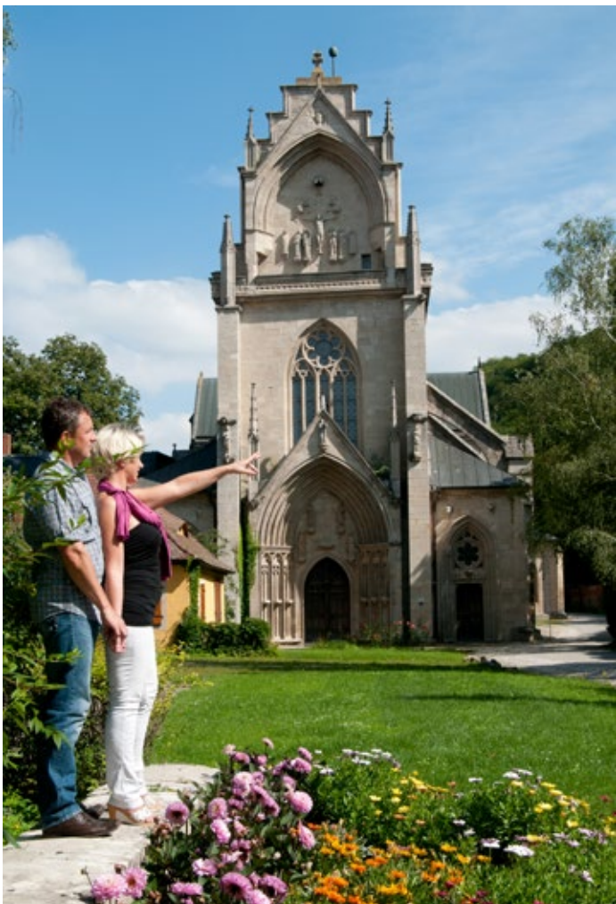
Ehemaliges Zisterzienserkloster Pforte

Eingebettet in der Kernregion Saale-Unstrut liegt das Bäderdreieck, bestehend aus den Orten Bad Bibra, Bad Kösen und Bad Sulza. In den Orten stehen dem Gast zahlreiche touristische Angebote, in Verbindung mit den Themen Gesundheit, Kur und Wellness zur Verfügung.