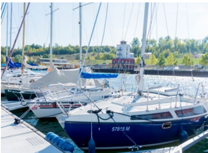
Bootsanleger an der Marina Mücheln