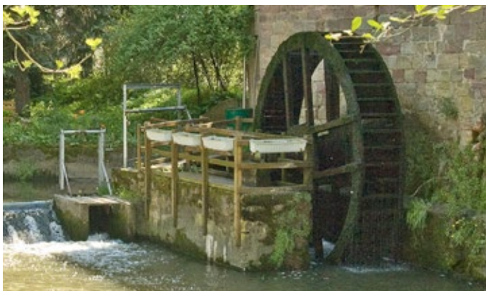
Neumühle im Kroppental bei Schönburg