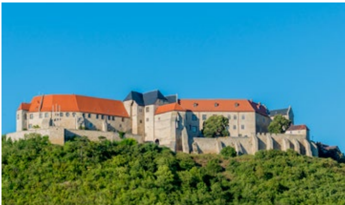
Schloss Neuenburg Freyburg