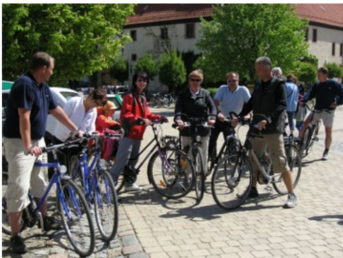
Anradeln an der Weißen Elster bei der Haynsburg

Wenn man im Droyßiger-Zeitzer Forst und Wethautal unterwegs ist, passiert man attraktiv abwechslungsreiche Landschaftsgebiete mit dörflich geprägter Lebenskultur und traditionellem Landleben. Einladend gelegen zwischen Naumburg und Zeitz präsentiert sich der Droyßiger-Zeitzer Forst und das Wethautal, als ein abwechslungsreiches Landschaftsgebiet mit dörflich geprägter Lebenskultur und traditionellem Landleben. Durch gute Verkehrsanbindungen und über die Saale-Unstrut-Elster-Radacht haben Besucher die Möglichkeit, einheimische Betriebe, die ihre Produkte direkt vermarkten, zu besuchen.