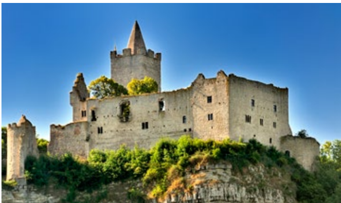
Rudelsburg Bad Kösen